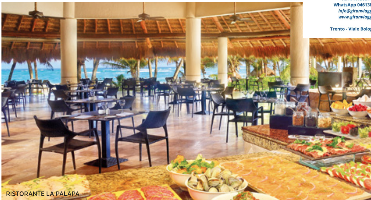
RISTORANTE LA PALAPA