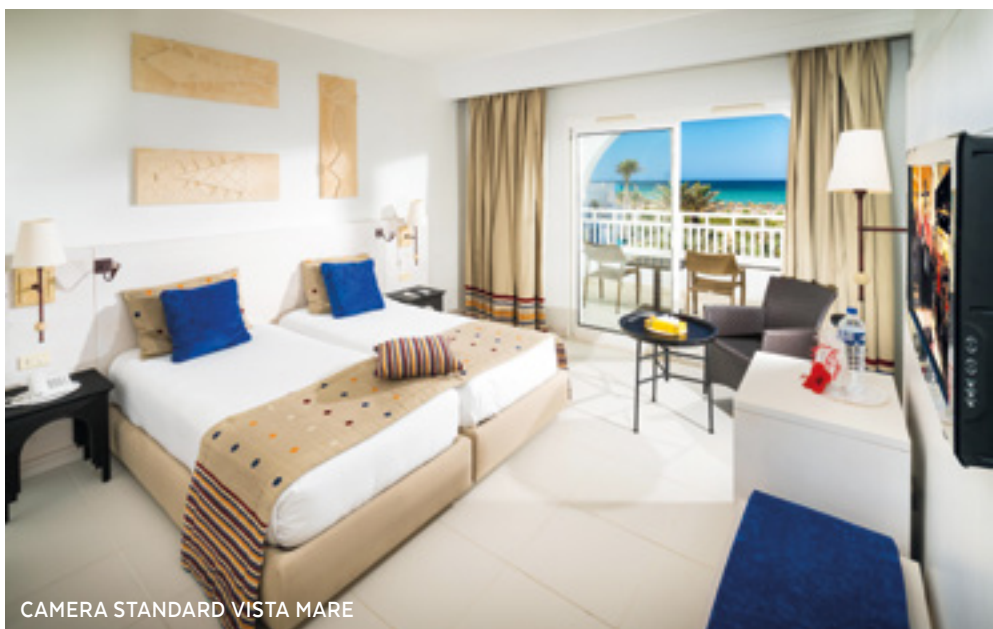
CAMERA STANDARD VISTA MARE

Le 316 camere sono tutte dotate di veranda o balcone, servizi privati con doccia, asciugacapelli, letto matrimoniale o letti separati, aria condizionata (dal 15 giugno al 15 settembre), Tv, cassetta di sicurezza, telefono; minibar a pagamento. Disponibili all'interno del resort camere denominate Bungalow Family dotate di più ampia metratura e composte di 2 ambienti (non separati). Corrente a 220 volt con prese a due poli.