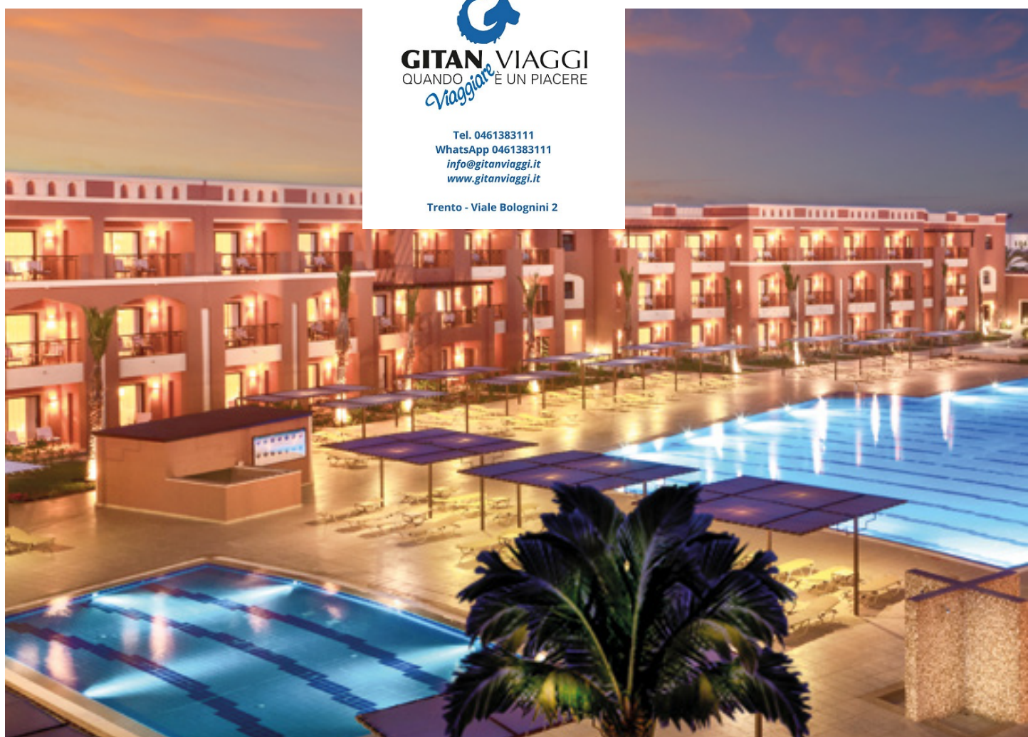
MARSA MATROUH VERACLUB JAZ TAMERINA