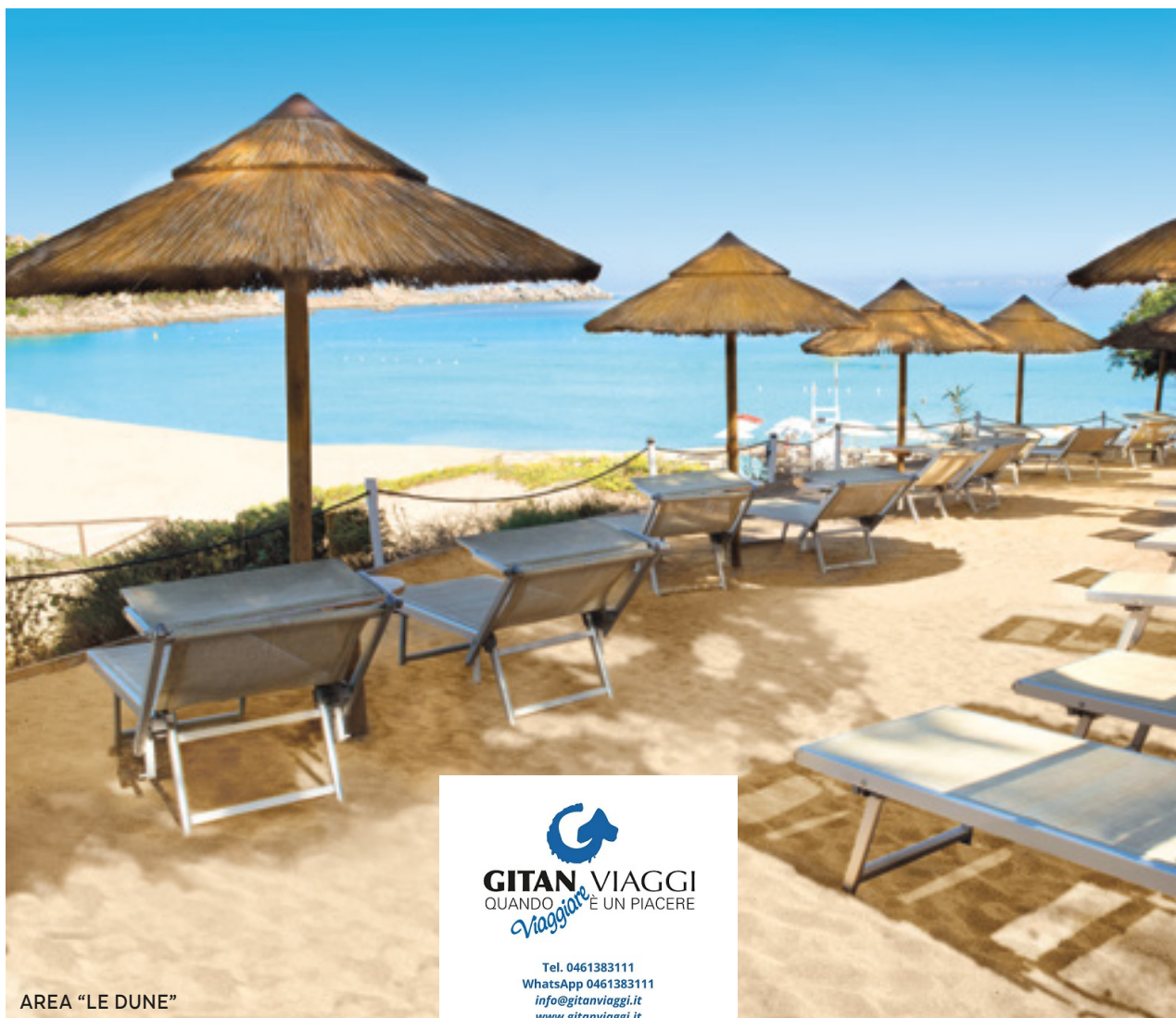
AREA "LE DUNE"