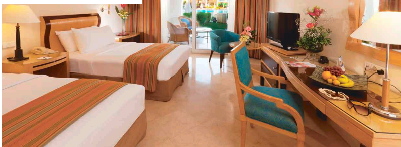
Doppia vista piscina