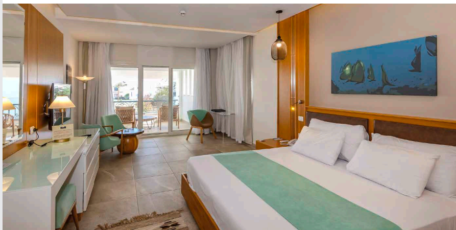
Doppia standard rinnovata

Tutti i vantaggi sono a disponibilità limitata e, se applicabili, saranno riportati nel preventivo di viaggio in base al tipo di camera scelta. Per ulteriori dettagli consulta le pagine finali.