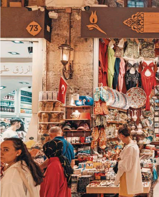
In questa pagina, dall'alto: bazar di Istanbul; Istanbul; lago salato Tuz Golu; Museo delle Civiltà Anatoliche ad Ankara.

Il nostro viaggio in Turchia è giunto al termine. Veniamo accompagnati all'aeroporto di Kayseri in tempo utile per l'imbarco sul volo di rientro in Italia, via Istanbul. Per chi ha il volo che rientra nel tardo pomeriggio, è possibile completare l'esperienza in Cappadocia aderendo a un'escursione facoltativa nella Valle di Soganli.