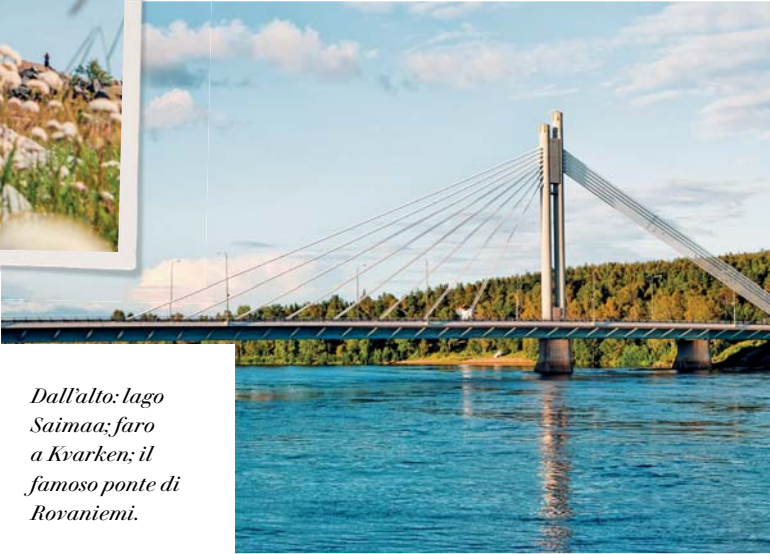
Dall'alto: lago Saimaa; faro a Kvarken; il famoso ponte di Rovaniemi.