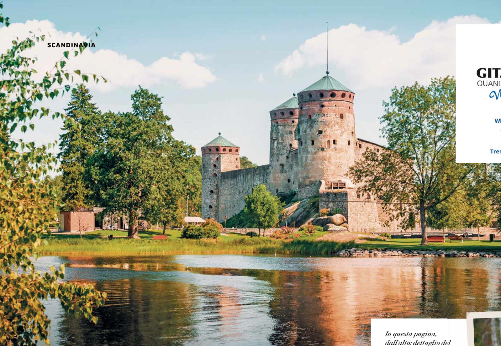
In questa pagina, dall'alto: dettaglio del castello di Savonlinna; Porvoo.