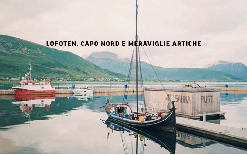
LOFOTEN, CAPO NORD E MERAVIGLIE ARTICHE