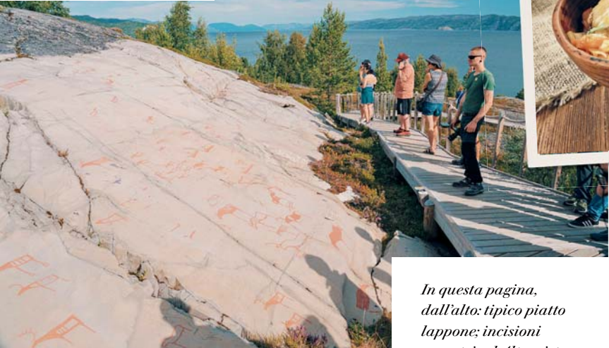
In questa pagina, dall'alto: tipico piatto lappone; incisioni rupestri ad Alta; vista dalla biblioteca centrale di Helsinki; renne in una fattoria di Sami.