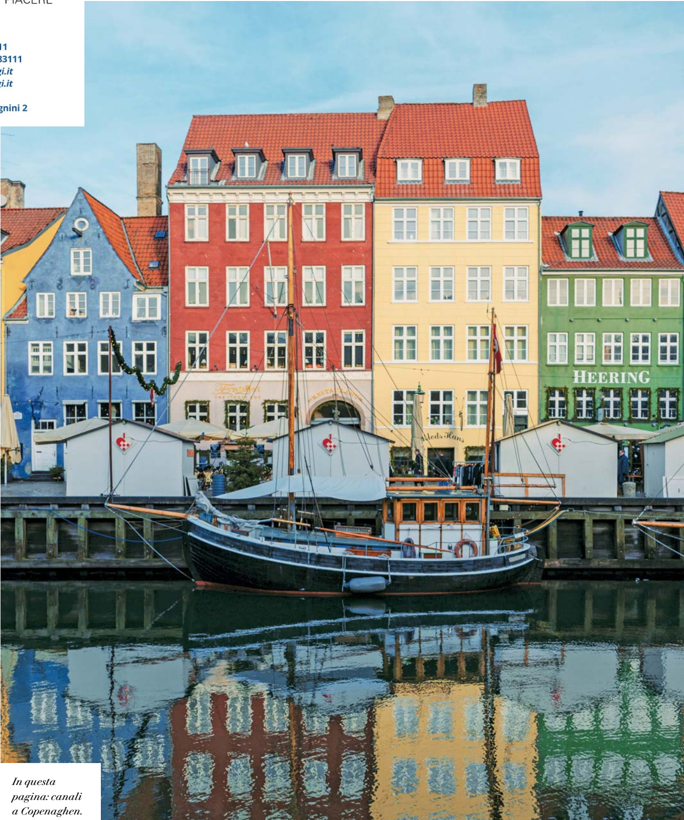
In questa pagina: canali a Copenaghen.