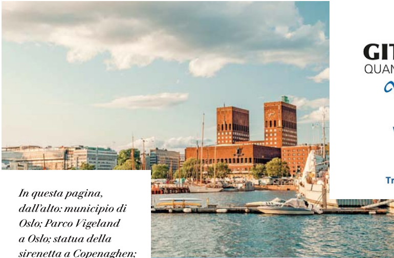
In questa pagina, dall'alto: municipio di Oslo; Parco Vigeland a Oslo; statua della sirenetta a Copenaghen; Göteborg.

Il nostro viaggio in Scandinavia è giunto al termine. In base all'orario del volo di ritorno, possiamo disporre ancora di un po' di tempo libero da dedicare allo shopping o alle visite in autonomia, prima di venire accompagnati all'aeroporto di Copenaghen in tempo utile per salire a bordo del volo di rientro in Italia.