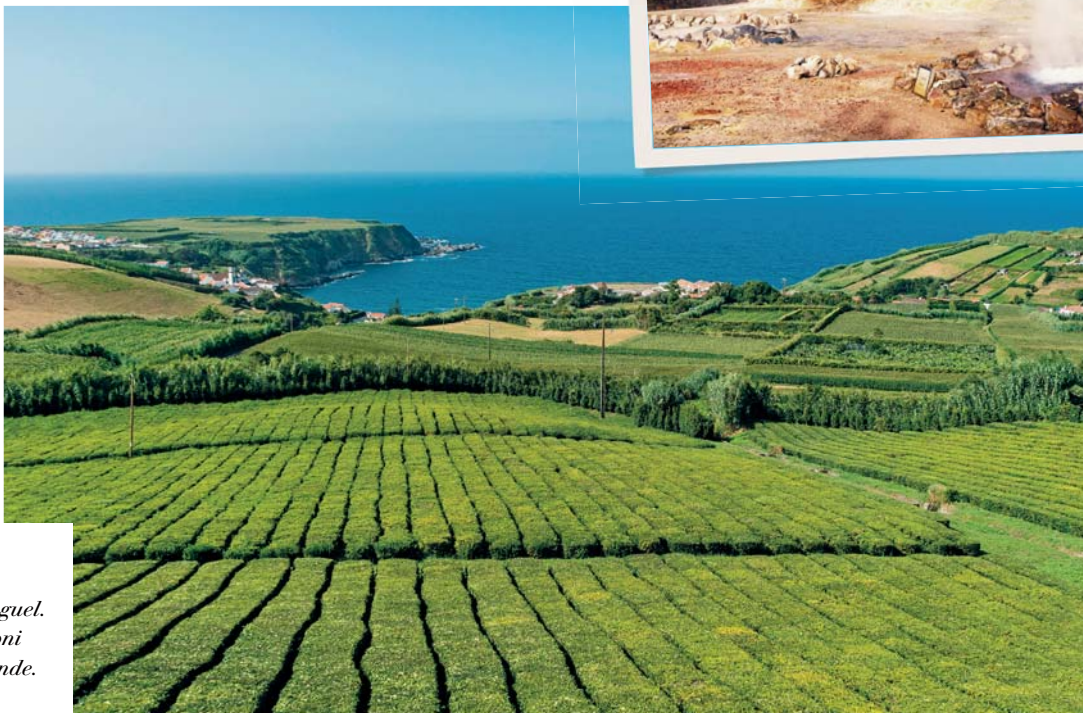
In alto: Furnas nell'isola di São Miguel. A destra: piantagioni di tè a Ribeira Grande.

Il nostro viaggio nella magia delle Azzorre volge al termine ed è arrivato il momento di salutare gli spettacolari paesaggi e le atmosfere uniche di queste magnifiche isole. Veniamo accompagnati all'aeroporto con un trasferimento privato, in tempo utile per salire a bordo del volo di rientro che ci riporta in Italia.