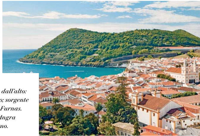
A sinistra, dall'alto: Monte Pico; sorgente termale a Furnas. A destra: Angra do Heroísmo.