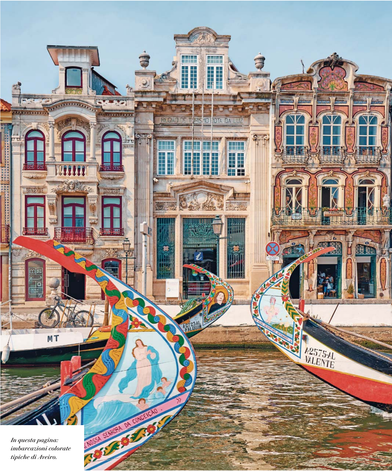
In questa pagina: imbarcazioni colorate tipiche di Aveiro.