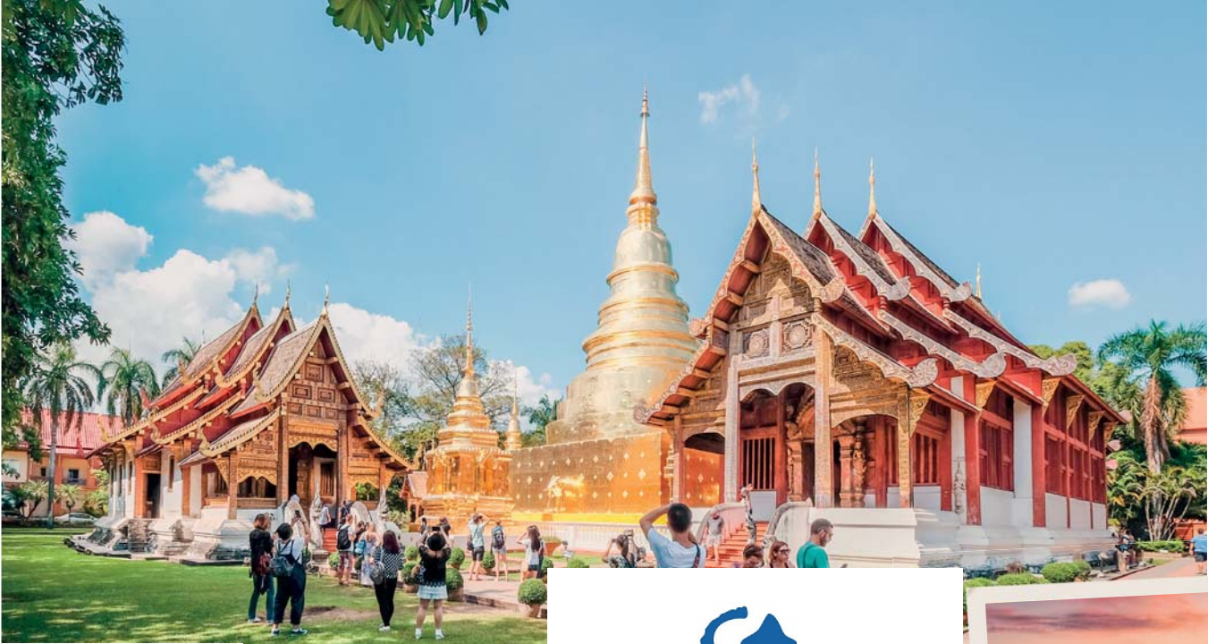
Dall'alto: Wat Phra Singh a Chiang Mai; grotta di Tham Ting;

Il nostro viaggio in Thailandia e in Laos è giunto al termine. In base all'orario del volo, veniamo accompagnati all'aeroporto in tempo utile per salire a bordo del volo di ritorno che ci riporta in Italia.