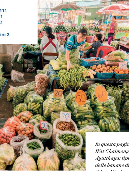
In questa pagina, dall'alto: Wat Chaimongkol a Ayutthaya; tipico mercato delle banane di Khampheng Pther; Wat Rong Khun a Chiang Rai; vivaio con produzione di orchidee.