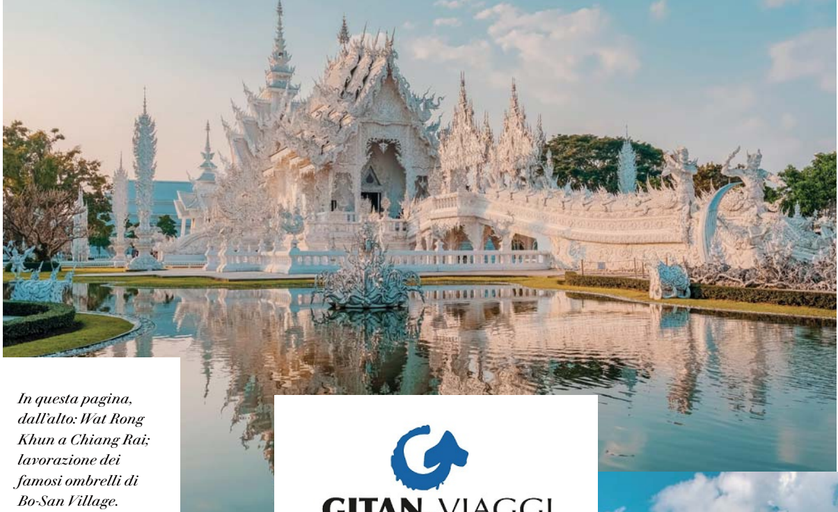
In questa pagina, dall'alto: Wat Rong Khun a Chiang Rai; lavorazione dei famosi ombrelli di Bo-San Village.

Il nostro viaggio in Thailandia è giunto al termine. In base all'orario del volo, veniamo accompagnati all'aeroporto in tempo utile per salire a bordo del volo di ritorno che ci riporta in Italia.