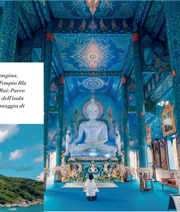
In questa pagina, dall'alto: Tempio Blu a Chiang Rai; Parco Nazionale dell'isola Similan; spiaggia di Khao Lak.