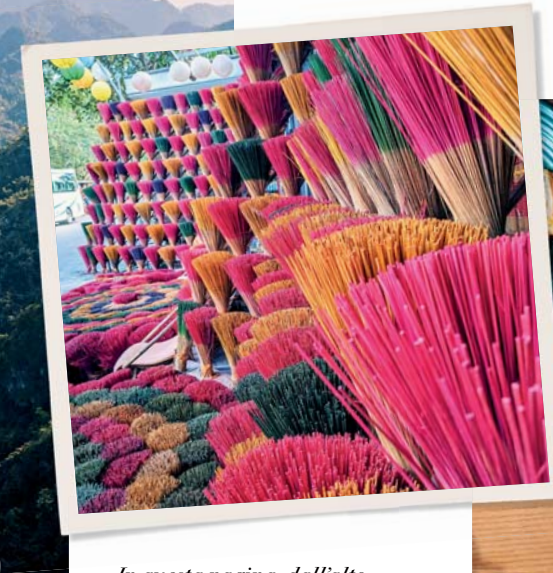
In questa pagina, dall'alto da destra: cibo tipico vietnamita; produzione di incenso nel villaggio di Thuy Xua; Hanoi; spiaggia di Khao Lak.