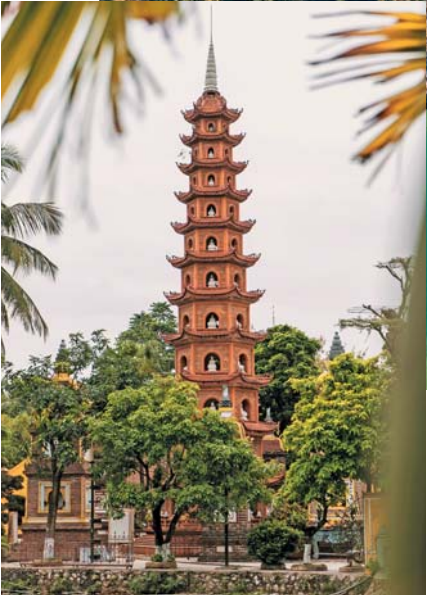
In questa pagina, dall'alto: Baia di Halong; pagoda di Tran Quoc ad Hanoi; Mausoleo di Ho Chi Minh.