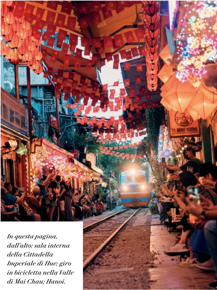
In questa pagina, dall'alto: sala interna della Cittadella Imperiale di Hue; giro in bicicletta nella Valle di Mai Chau; Hanoi.