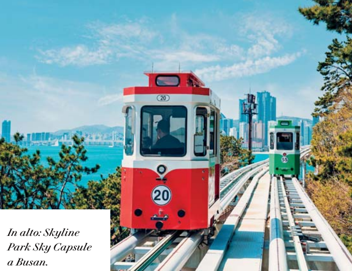
In alto: Skyline Park Sky Capsule a Busan.

Proseguiamo il nostro viaggio verso l'interno della Corea, fino a raggiungere il Parco Nazionale di Gayasan . Qui si