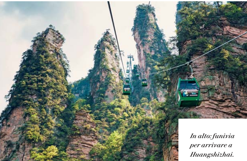
In alto: funivia per arrivare a Huangshizhai.