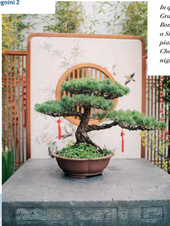
In questa pagina, dall'alto: Grande Moschea di Xi'an; Bonsai nel Giardino di Yu a Shanghai; vista dalla piattaforma Cloud Eye a Chongqing; Hongyadong by night.