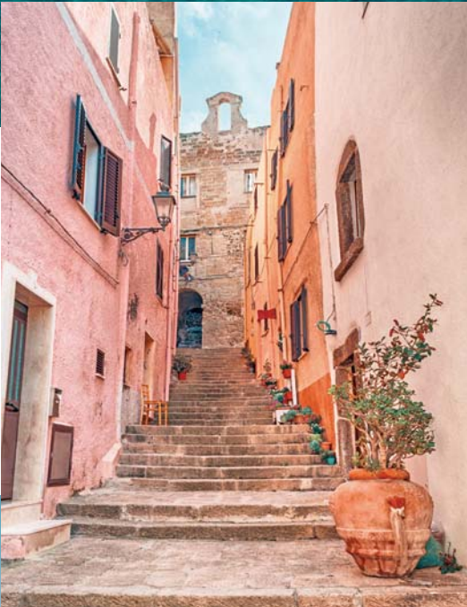
In questa pagina, dall'alto: Alghero; Castelsardo; Cala Napoletana a Caprera.