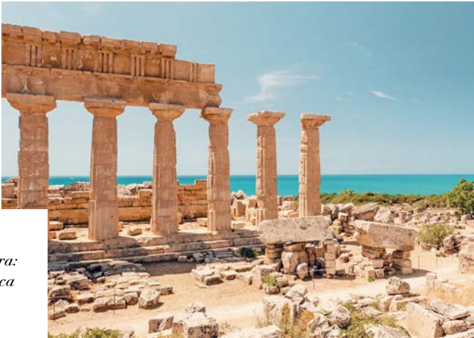
A sinistra: Siracusa. A destra: zona archeologica di Selinunte.