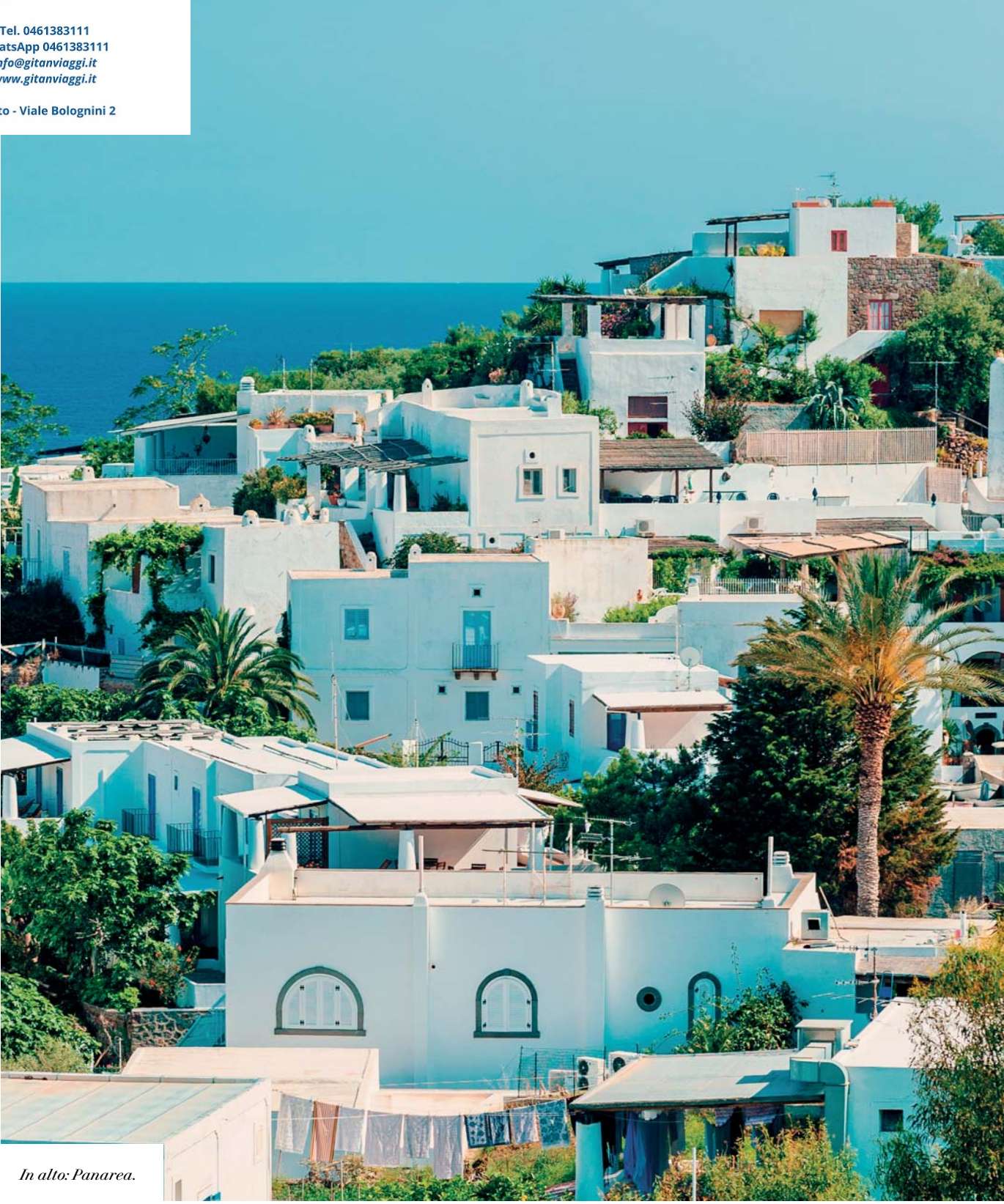
In alto: Panarea.