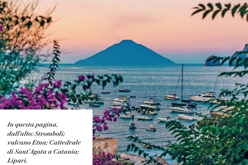
In questa pagina, dall'alto: Stromboli; vulcano Etna; Cattedrale di Sant'Agata a Catania; Lipari.

Il nostro viaggio in Sicilia è arrivato al termine. In base all'orario di partenza del volo, possiamo avere del tempo libero da dedicare allo shopping o alle visite in autonomia, prima di venire accompagnati all'aeroporto per il rientro. L'assistente è a disposizione per organizzare il trasferimento all'aeroporto in tempo utile per la partenza.