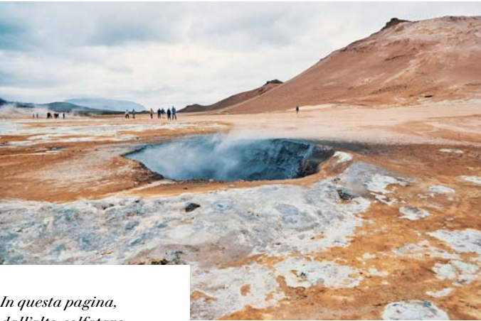
In questa pagina, dall'alto: solfatore di Námaskard; centro di Reykjavík; cascate di Godafoss.