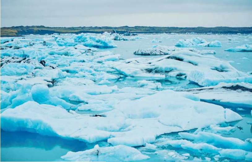
In questa pagina, dall'alto: laguna glaciale di Jökulsárlón; geyser Strokkur; casette colorate di Reykjavík; canyon Ásbyrgi.

La mattinata è dedicata alla scoperta della penisola di Snæfellsnes . Visitiamo Dalir , luogo che combina attrazioni storiche e culturali con un incantevole mondo di fauna selvatica e natura. Sostiamo al Museo dello Squalo , la cui esposizione illustra la biologia dello squalo, le sue abitudini, le modalità di pesca e di lavorazione della sua carne. Proseguiamo per ammirare le scogliere di Arnastapi e di Londrangar , e la montagna di Kirkjufell , uno