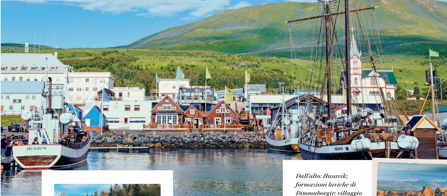
Dall'alto: Husavik; formazioni laviche di Dimmuborgir; villaggio di Djupivogur.