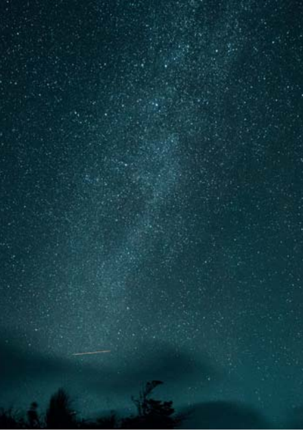
In alto: cielo stellato a Holmavik. Sotto: cittadina di Stykkishólmur.