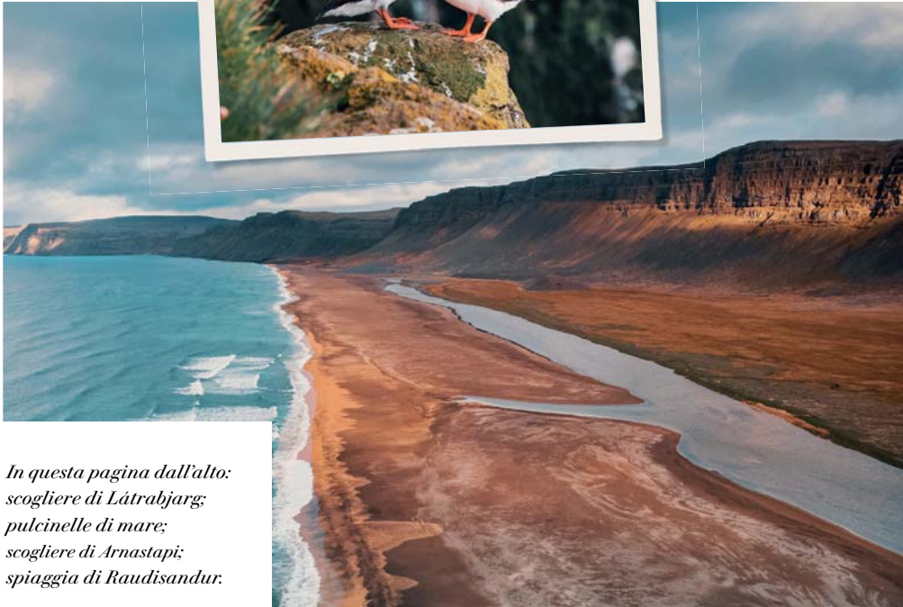
In questa pagina dall'alto: scogliere di Látrabjarg; pulcinelle di mare; scogliere di Arnastapi; spiaggia di Raudisandur.

Il nostro viaggio in Islanda è giunto al termine. In base all'orario del volo di ritorno, possiamo disporre ancora di un po' di tempo libero da dedicare allo shopping o alle visite in autonomia a Reykjavik, prima di venire accompagnati all'aeroporto in tempo utile per salire a bordo del volo di rientro in Italia.