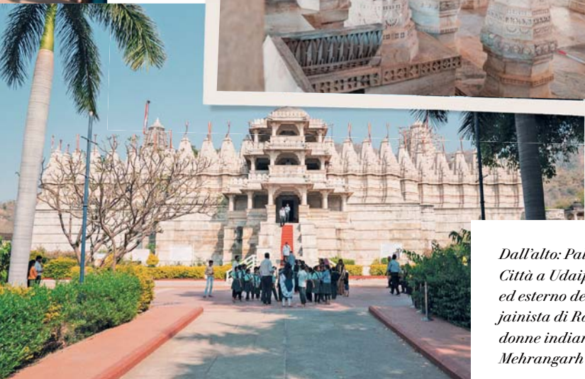
Dall'alto: Palazzo di Città a Udaipur; interno ed esterno del complesso jainista di Ranakpur; donne indiane al Forte di Mehrangarh a Jodhpur.