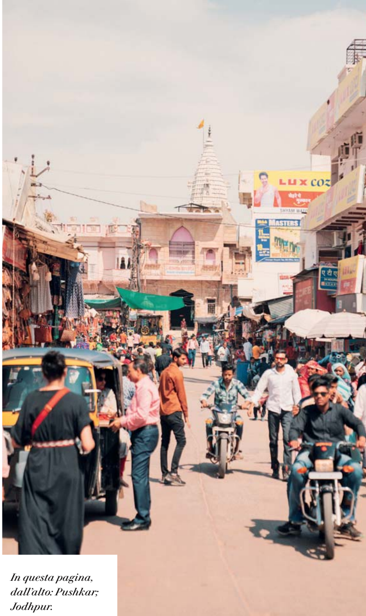
In questa pagina, dall'alto: Pushkar; Jodhpur.

Il nostro viaggio in India è arrivato alla sua conclusione e dobbiamo ora prepararci a salutare questa affascinante e indimenticabile nazione. Nella notte veniamo accompagnati all'aeroporto di Delhi per ripartire, in tempo utile per salire a bordo del volo di rientro che ci riporta in Italia.