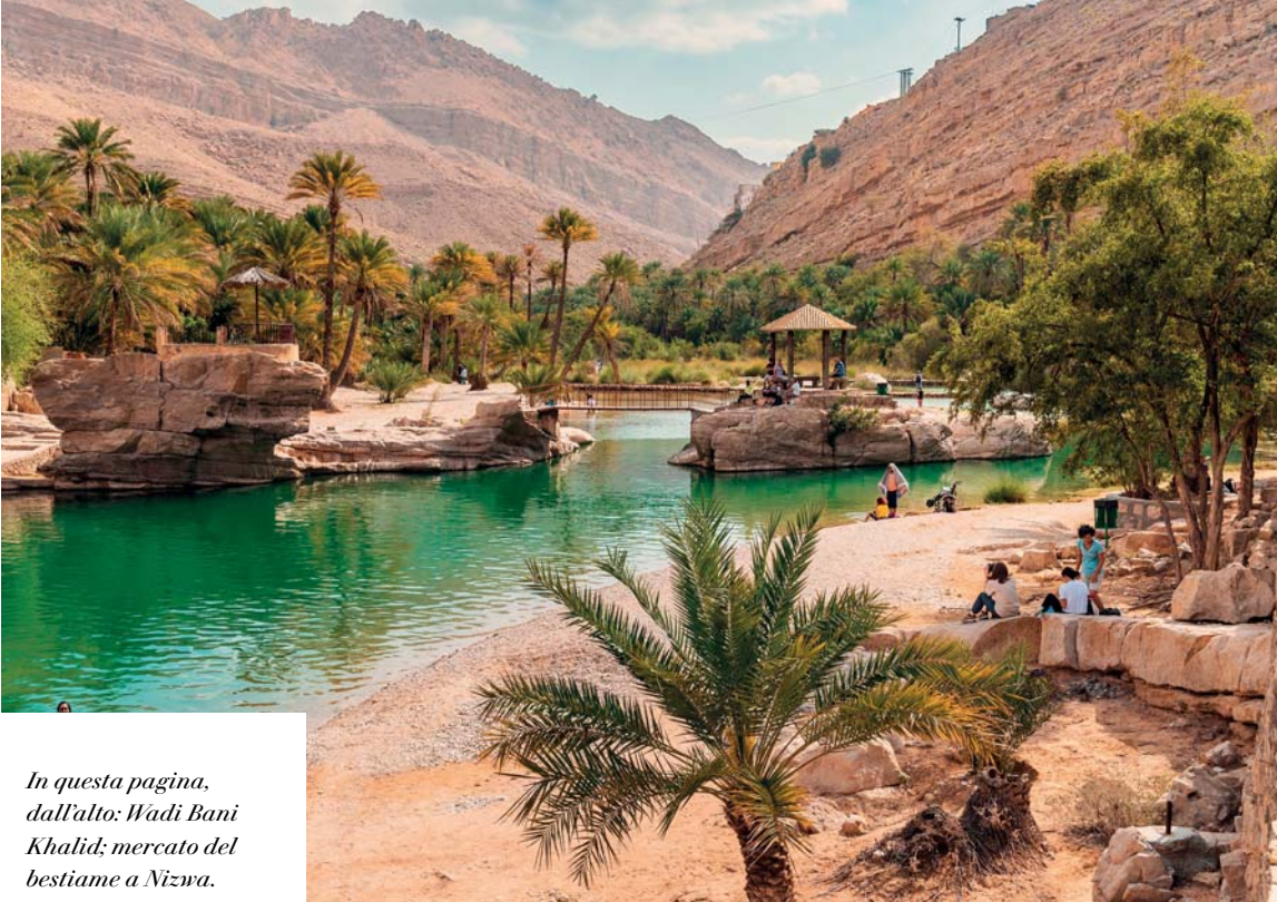
In questa pagina, dall'alto: Wadi Bani Khalid; mercato del bestiame a Nizwa.

La mattina, dopo la colazione, partiamo per le montagne di Jabal Akhdar, con una sosta lungo il percorso al villaggio di Birkat al Mauz , dove visitiamo uno dei cinque siti Patrimonio Mondiale dell'UNESCO dell'Oman, il canale d'acqua (Falaj al Khatmeen) immerso in una florida piantagione di palme da dattero. Riprendiamo il viaggio verso Jabal Akhdar , visitando alcuni villaggi di montagna. Questa zona è particolarmente famosa per la coltivazione delle rose da cui si ricava la delicata "acqua" largamente utilizzata nella profumeria e nella cosmesi. Ci fermiamo per visitare un laboratorio e capire il processo di trasformazione dai petali all'acqua di rose. Proseguiamo per Jebel Shams , la montagna più alta dell'Oman e raggiungiamo il famoso "Sentiero del Balcone". Fiancheggiando la montagna raggiungiamo il villaggio abbandonato di Ghul passando per fattorie e laghi. La passeggiata di ritorno lungo il sentiero offre viste mozzafiato sul canyon da 2.000 metri.