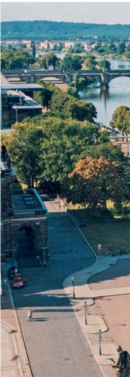
In questa pagina, dall'alto: panorama di Dresda; Weimar.