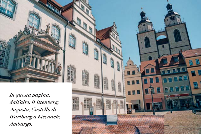
In questa pagina, dall'alto: Wittenberg; Augusta; Castello di Wartburg a Eisenach; Amburgo.

Tour in pullman: al mattino iniziamo il nostro viaggio di rientro in Italia. Lungo il percorso sono previste alcune soste per il ristoro e il pranzo libero. L'arrivo è previsto nel tardo pomeriggio. Tour in aereo: in base all'orario del volo di ritorno, abbiamo del tempo a disposizione per shopping o visite in autonomia, prima di venire accompagnati all'aeroporto per il rientro. L'assistente è a disposizione per organizzare il trasferimento all'aeroporto in tempo utile per la partenza.