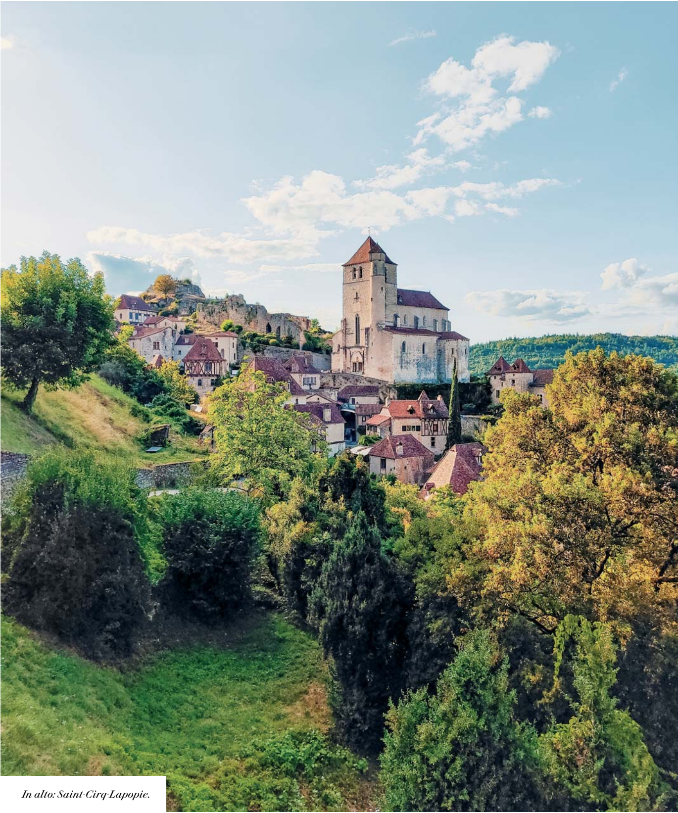
In alto: Saint-Cirq-Lapopie.