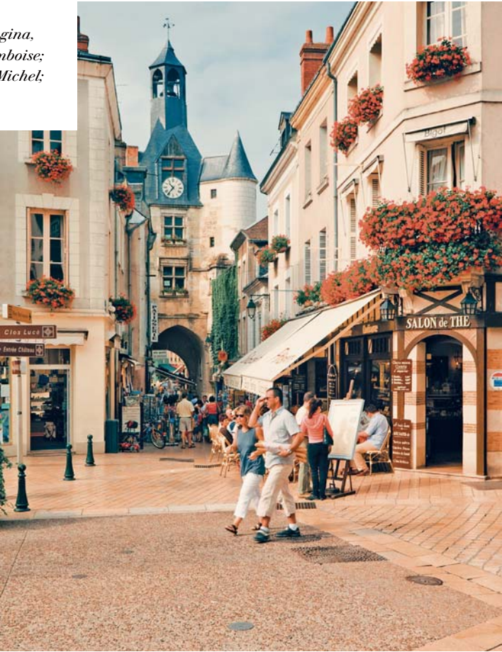
In questa pagina, dall'alto: Amboise; Mont Saint-Michel; Poitiers.

In aggiunta ai servizi inclusi (pag. 22) avrai anche: