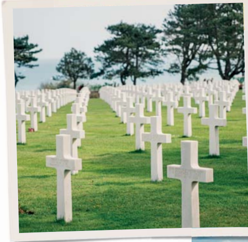
In questa pagina, dall'alto: Castello di Clos-Lucé ad Amboise; Cimitero americano di Colleville-sur-Mer; Arromanches.