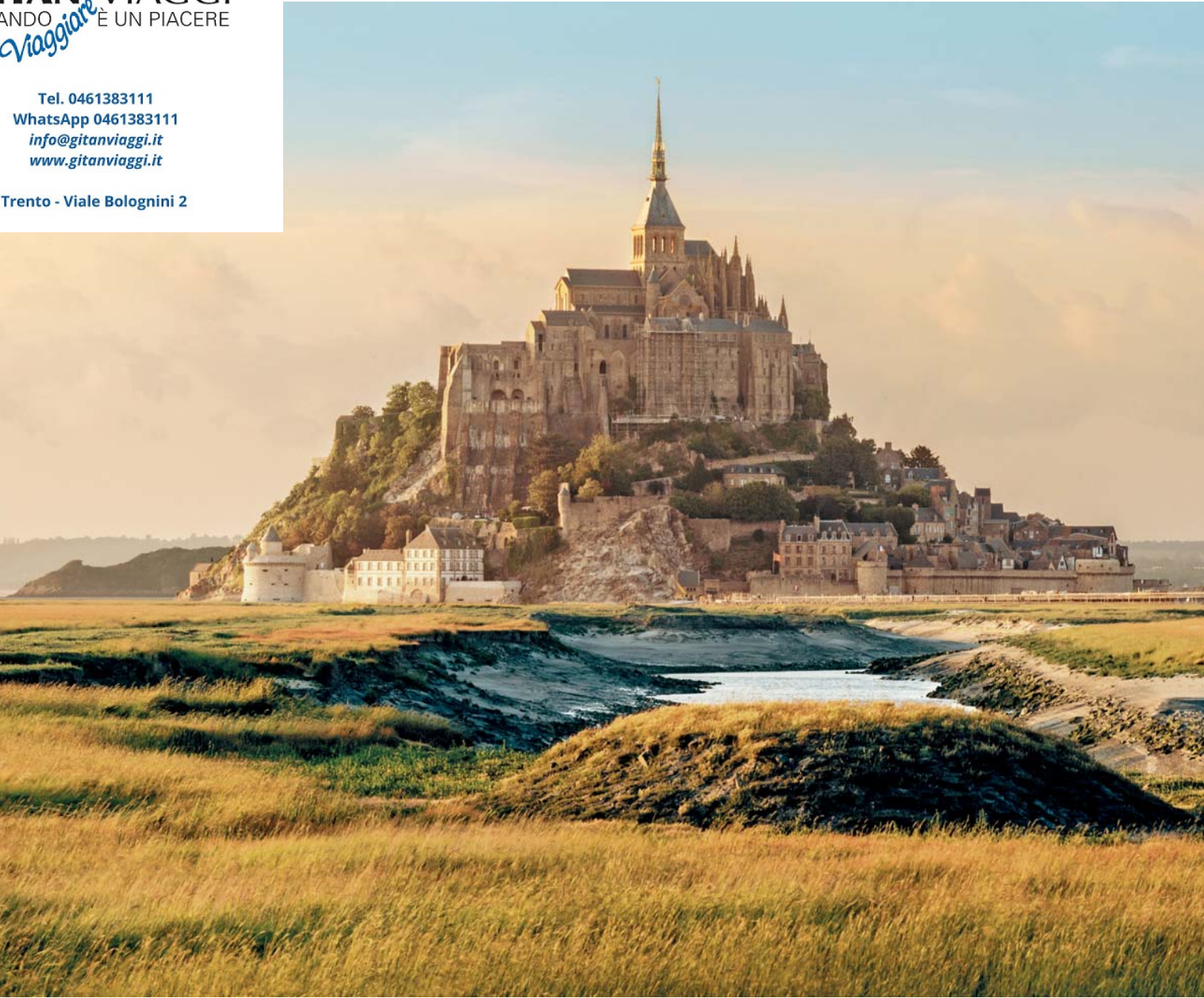
In alto: Mont Saint-Michel.