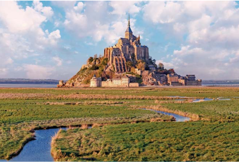
In questa pagina, dall'alto: Mont Saint-Michel; Rouen; spiagge dello Sbarco; casa di Monet a Giverny.

È l'ultimo giorno del nostro viaggio in Francia, che ci ha portato alla scoperta degli splendidi patrimoni naturali e culturali di Bretagna e Normandia. Saliamo a bordo del pullman e iniziamo il nostro viaggio di rientro in Italia, con delle soste per il ristoro e per il pranzo libero lungo il percorso.