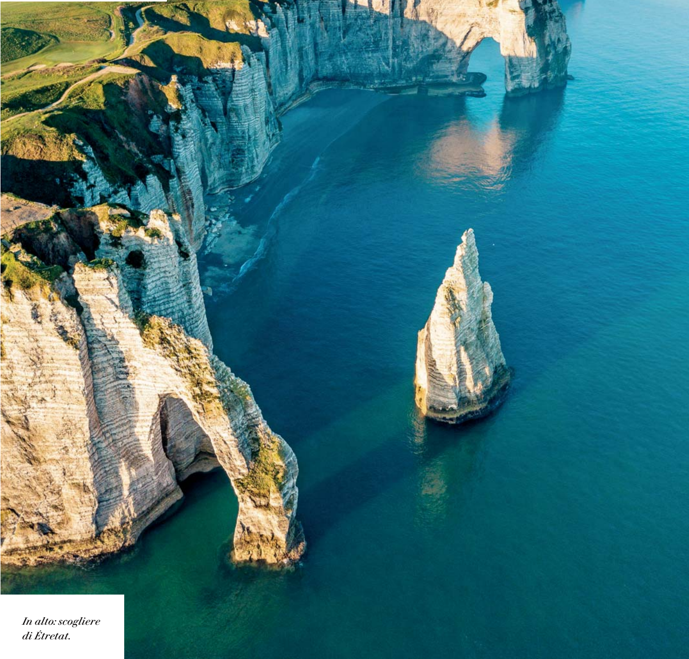
In alto: scogliere di Étretat.