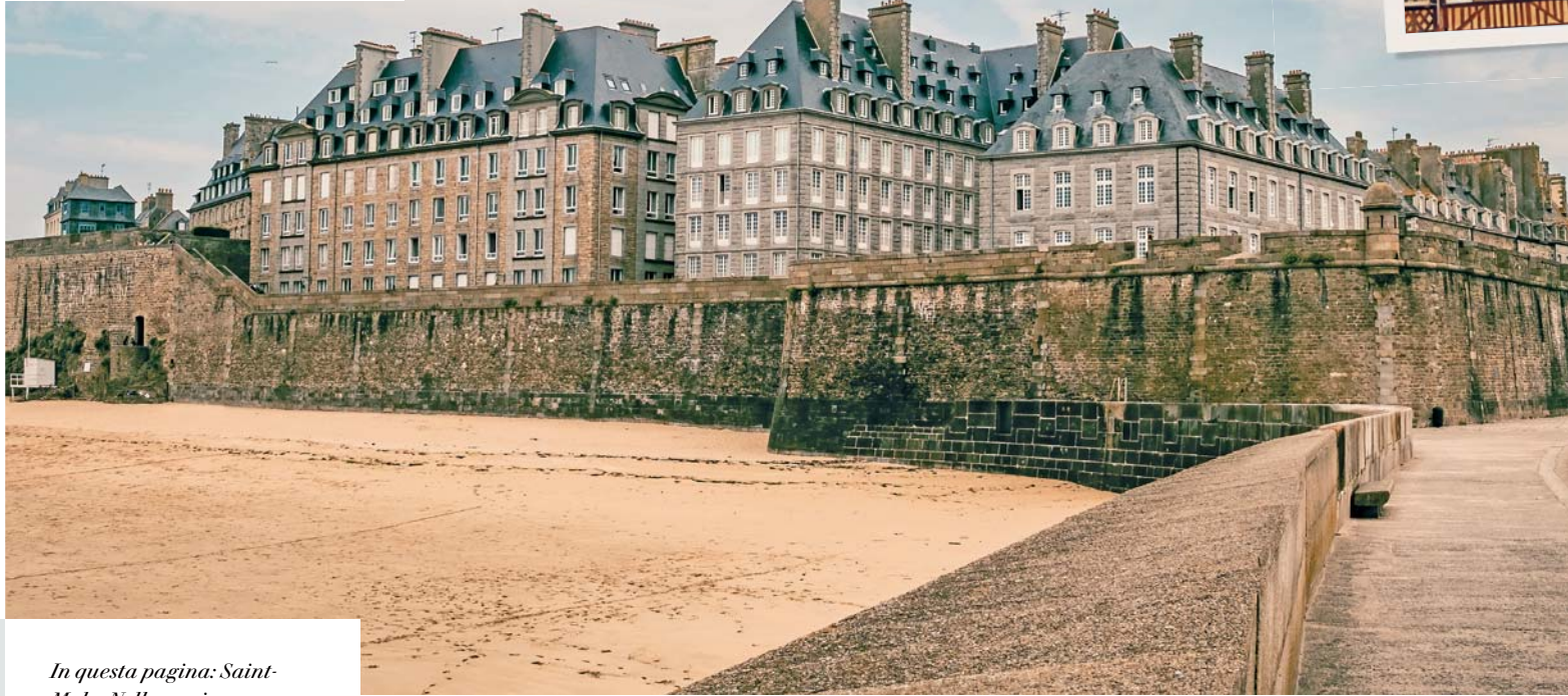
In questa pagina: Saint-Malo. Nella pagina a fianco, da sinistra: Rennes; cattedrale di Quimper.