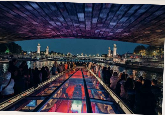
In questa pagina, dall'alto: giro sulla Senna a Parigi; Mont Saint-Michel; Honfleur.