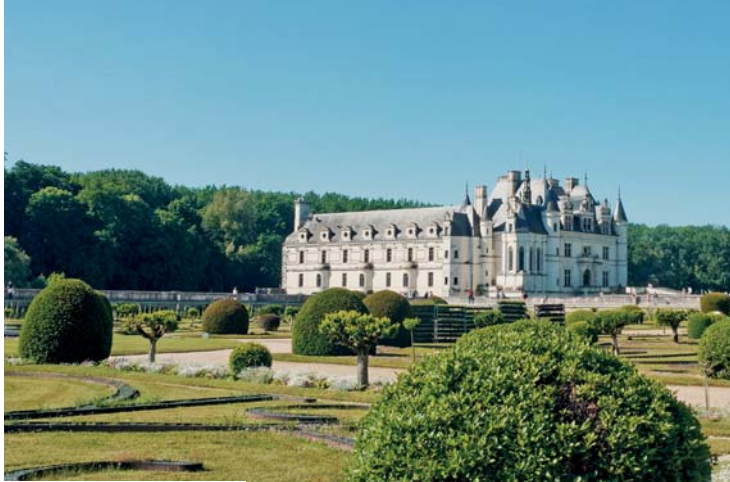
In questa pagina, dall'alto: Castello di Chenonceau; Arromanches; Concarneau.

Tour in pullman: arriviamo a Clermont-Ferrand, e visitiamo il suo centro con l'accompagnatore. La cena è prevista in hotel. Tour in aereo: salutiamo l'accompagnatore e il resto del