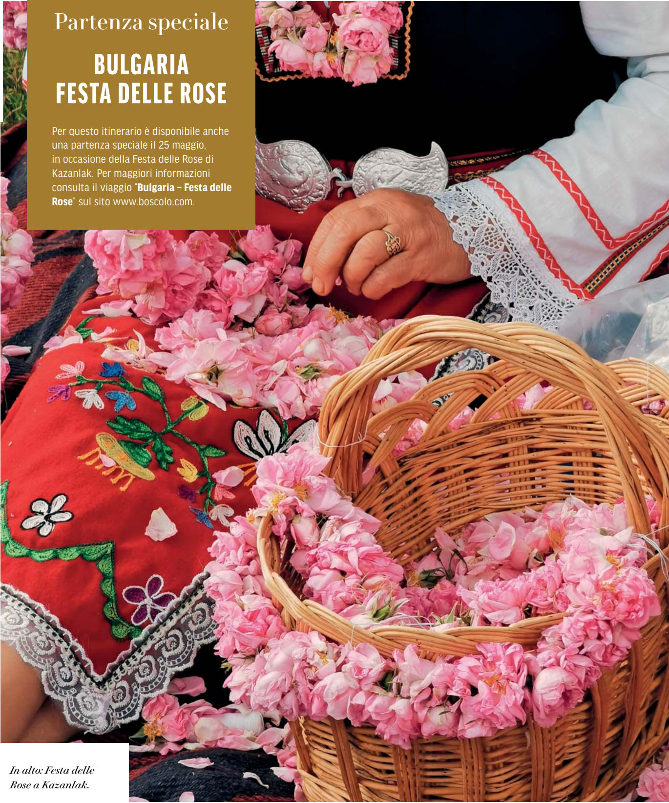
In alto: Festa delle Rose a Kazanlak.

Per questo itinerario è disponibile anche una partenza speciale il 25 maggio, in occasione della Festa delle Rose di Kazanlak. Per maggiori informazioni consulta il viaggio "Bulgaria - Festa delle Rose" sul sito www.boscolo.com .