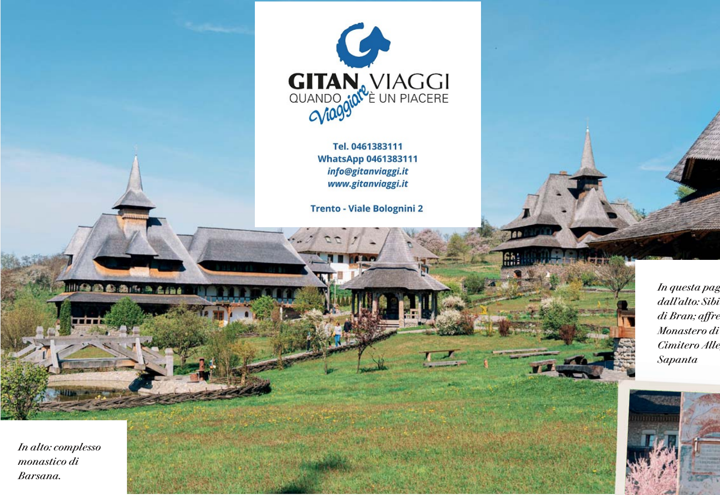
In alto: complesso monastico di Barsana.

Salutiamo Targu Neamt o Piatra Neamt per rientrare a Bucarest , facendo una sosta a Vrancea , dove ci fermiamo in una cantina della zona per un pranzo tipico con assaggio di vini locali. Con un patrimonio viticolo di oltre 26mila ettari, Vrancea vanta il 10% della superficie viticola della Romania. A ogni passo ci sono vitigni, da cui si producono alcuni dei migliori vini bianchi d'Europa. Proseguiamo poi per Bucarest, dove all'arrivo facciamo una