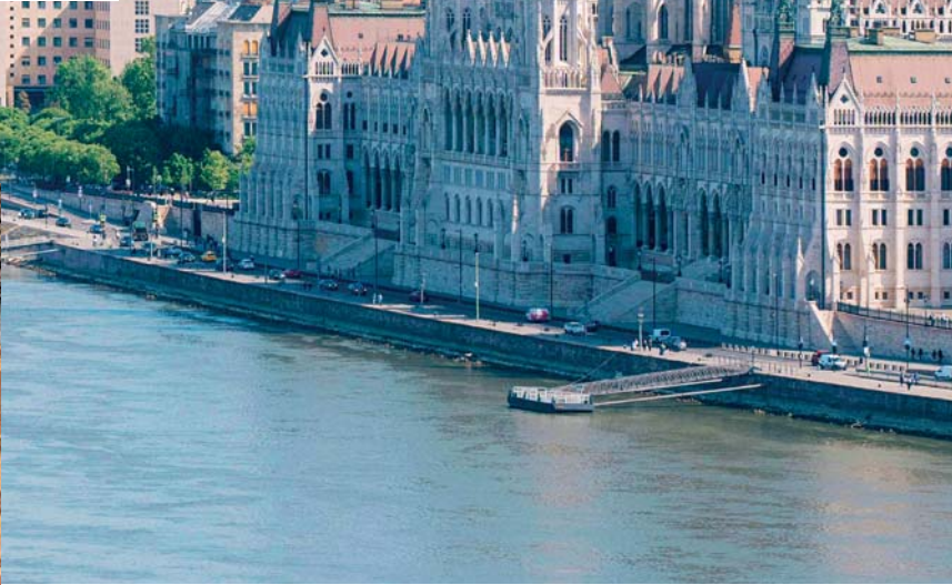
In questa pagina, dall'alto: Parlamento di Budapest; Piazza dell'Orologio a Praga; collina di Buda a Budapest.