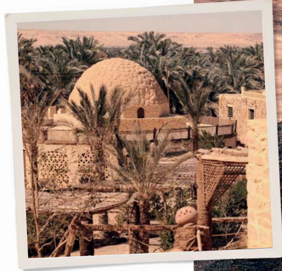
In questa pagina, da sinistra: oasi di Bahariya; Deserto Nero.

Il nostro viaggio in Egitto è arrivato al termine, e abbiamo le ultime ore a disposizione prima di salutare la terra dei faraoni e le sue indimenticabili meraviglie. A seconda dell'orario di partenza, veniamo accompagnati all'aeroporto in tempo utile per salire a bordo del volo di rientro che ci riporta in Italia.