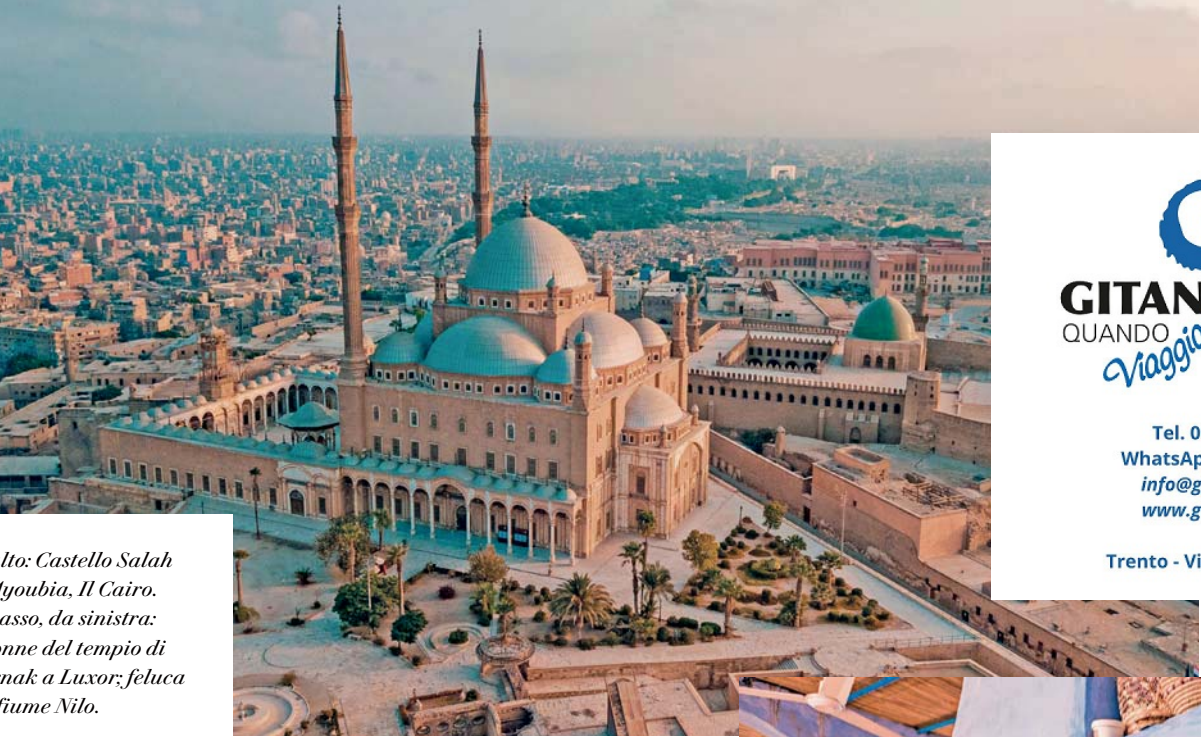
In alto: Castello Salah Al-Ayoubia, Il Cairo. In basso, da sinistra: colonne del tempio di Karnak a Luxor; feluca sul fiume Nilo.