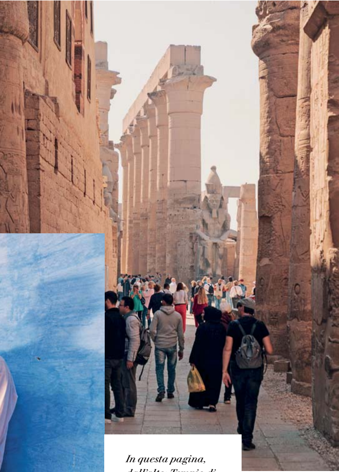
In questa pagina, dall'alto: Tempio di Luxor; egiziani che fumano il narghilè ad Assuan; Tempio di Philae.