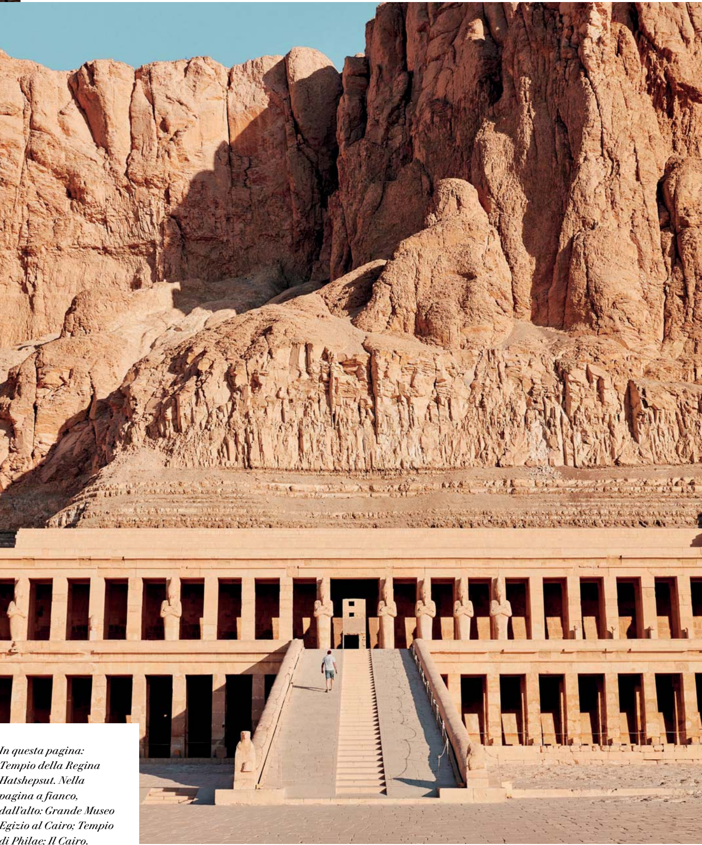
In questa pagina: Tempio della Regina Hatshepsut. Nella pagina a fianco, dall'alto: Grande Museo Egizio al Cairo; Tempio di Philae; Il Cairo.

Assuan: escursione ai templi di Abu Simbel con partenza in bus.