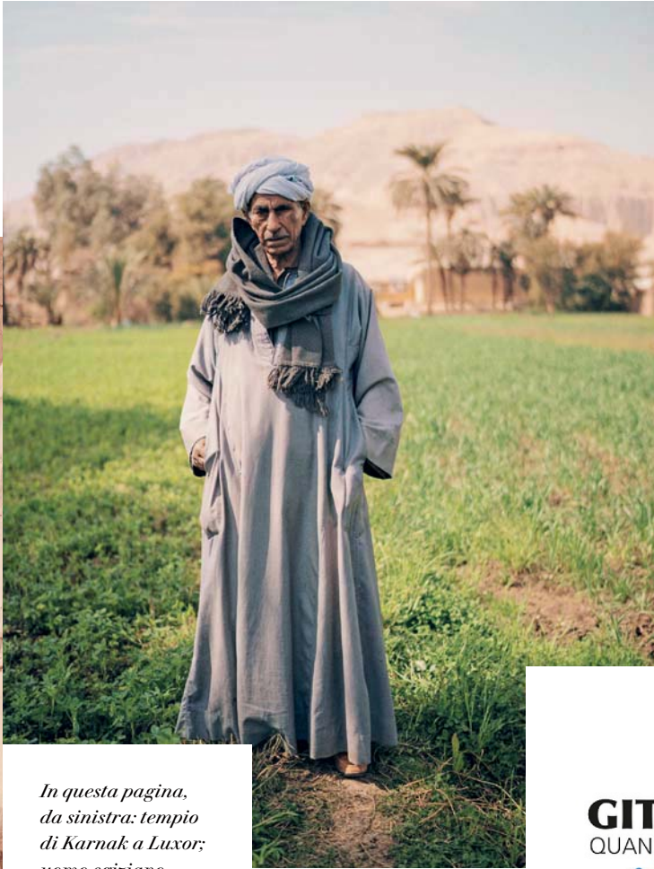
In questa pagina, da sinistra: tempio di Karnak a Luxor; uomo egiziano.

Assuan: escursione ai templi di Abu Simbel con partenza in bus.