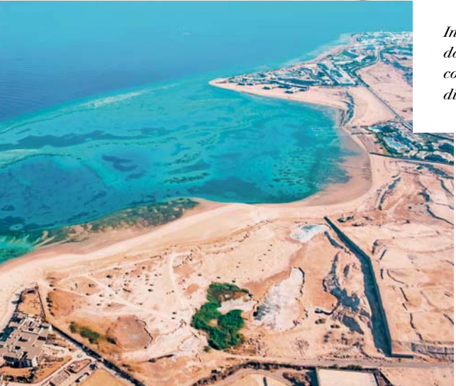
In questa pagina, dall'alto: barriera corallina; spiagge di Hurghada.

Lasciamo Luxor per raggiungere le incantevoli spiagge del Mar Rosso, una meta prediletta per gli amanti del relax che non ha bisogno di presentazioni, dove troviamo ad attenderci un mare dai riflessi straordinari. Arriviamo nel resort, dove ci prepariamo a trascorrere il resto del nostro viaggio. Il pranzo e la cena sono previsti in hotel.