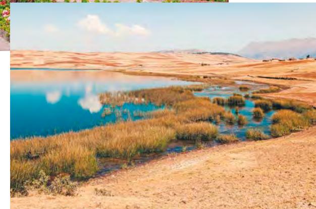
In questa pagina, dall'alto: Cuzco; Laguna di Huaypo; Arequipa. A destra: tessitrice di lana a Cuzco.