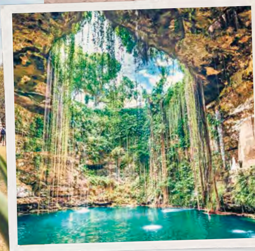
In questa pagina, dall'alto: piatto tipico messicano; tipiche danze messicane; cenote; cascate di Agua Azul.