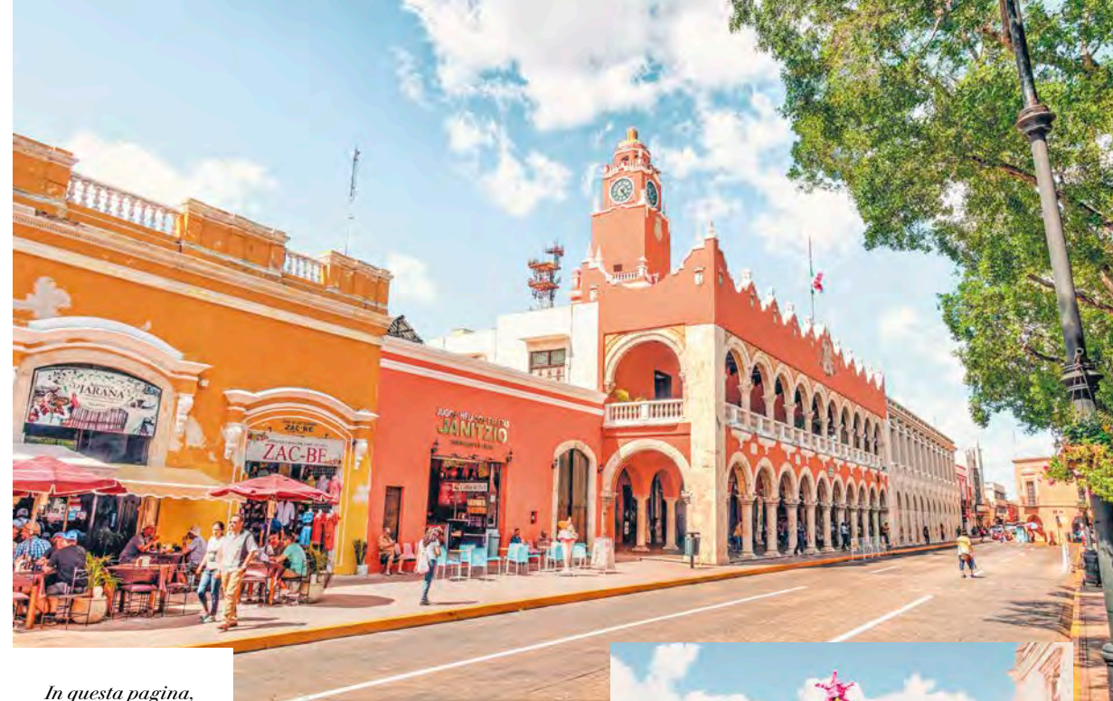
In questa pagina, dall'alto: Mérida; sito archeologico di Chichén Itzá.

Dopo aver viaggiato nella notte, nel pomeriggio atterriamo in Italia e concludiamo così la nostra vacanza.