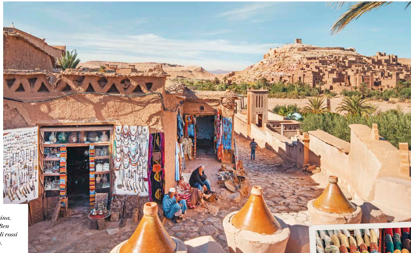
In questa pagina, dall'alto: Ait Ben Haddou; vicoli rossi di Marrakech.

In base all'orario del volo possiamo avere del tempo libero a disposizione prima di venire accompagnati in aeroporto per il rientro.