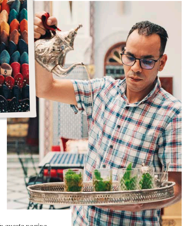
In questa pagina, da sinistra: Tetouan; babouche al souk; tè alla menta.