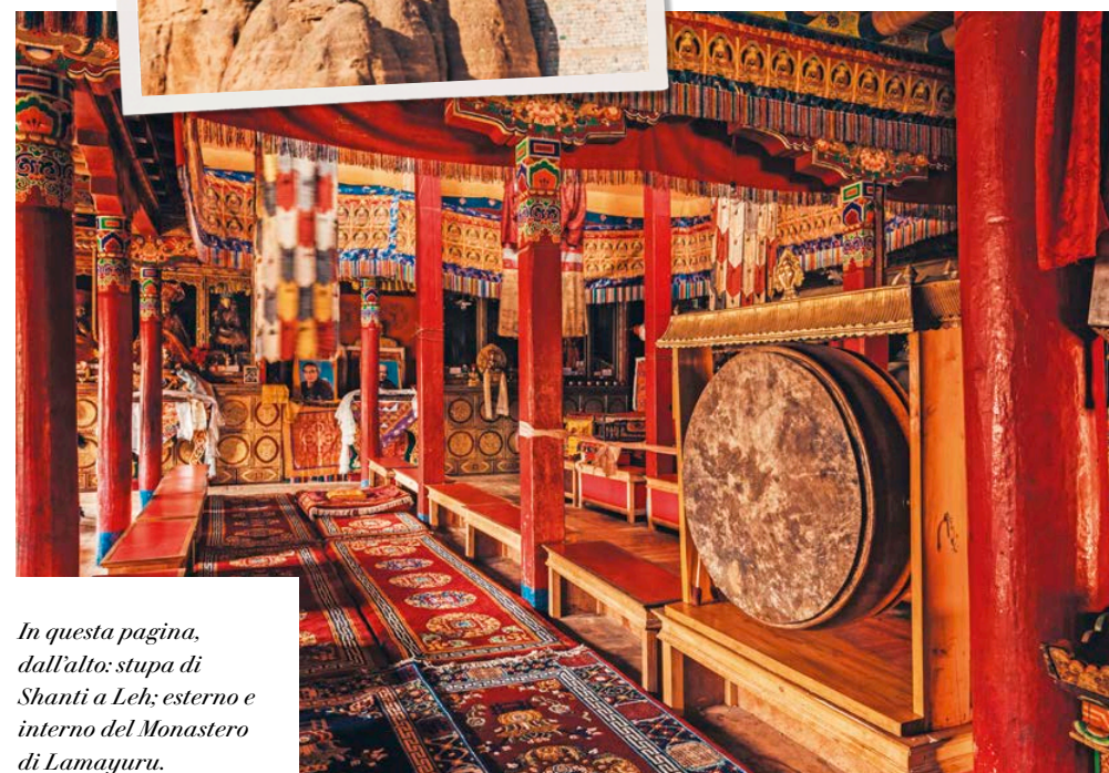
In questa pagina, dall'alto: stupa di Shanti a Leh; esterno e interno del Monastero di Lamayuru.