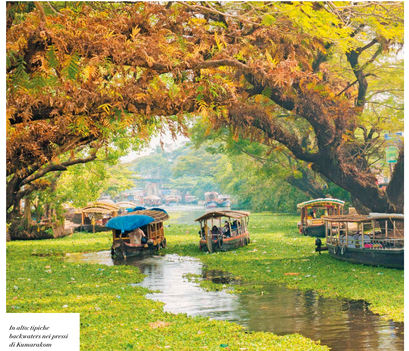
In alto: tipiche backwaters nei pressi di Kumarakom