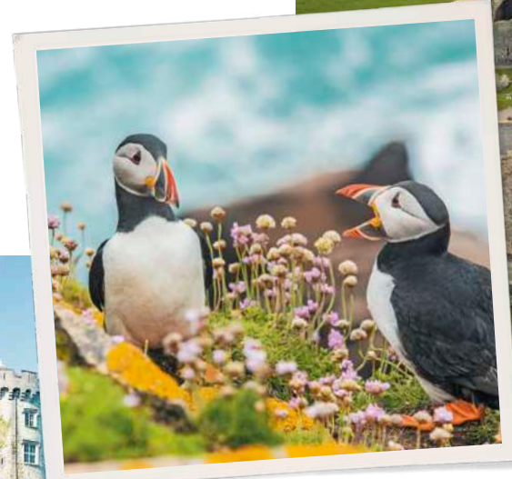
In questa pagina, in alto: rovine della Rocca di San Patrizio a Cashel; pulcinelle di mare; castello di Kilkenny.