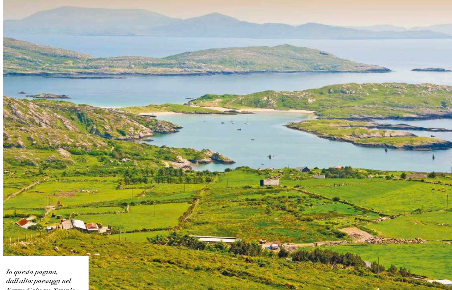
In questa pagina, dall'alto: paesaggi nel Kerry; Galway, Temple Bar a Dublino.

Raggiungiamo la gloriosa Cashel per visitare, in cima a un colle, le rovine della Rocca di San Patrizio . Dopo il pranzo libero ci spostiamo a Kilkenny , dove visitiamo la Cattedrale medievale di St. Canice e gli esterni del Castello. Ci dirigiamo poi a Dublino in tempo per la cena di arrivederci.