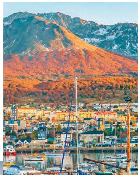
In questa pagina, dall'alto: paesaggio della Terra del Fuoco in Patagonia; Ushuaia; Faro Les Eclaireurs a Ushuaia.