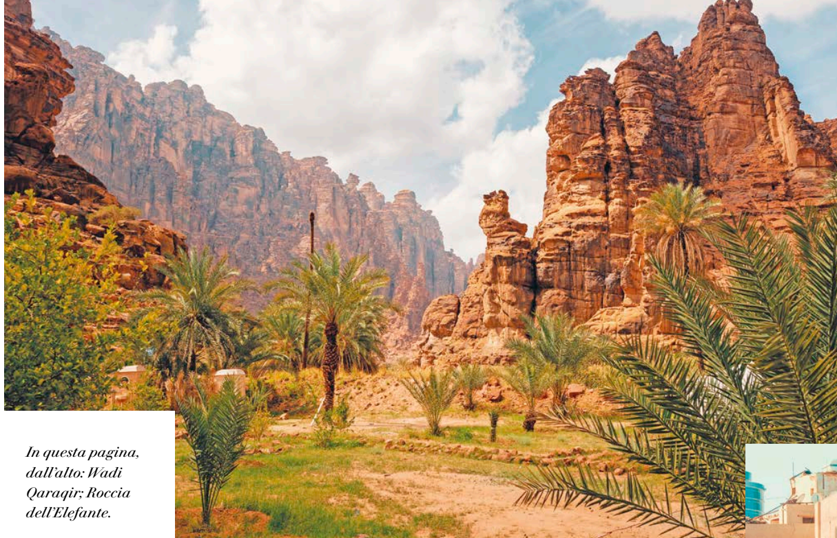
In questa pagina, dall'alto: Wadi Qaragir; Roccia dell'Elefante.

Il nostro viaggio in Arabia Saudita è arrivato al termine, e dobbiamo prepararci a salutare questa nazione indimenticabile e le sue meraviglie. Dopo la prima colazione veniamo accompagnati all'aeroporto internazionale di Jeddah in tempo utile per salire a bordo del volo di rientro che ci riporta in Italia.