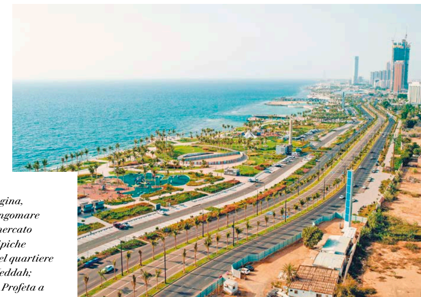
In questa pagina, dall'alto: lungomare di Jeddah; mercato di Jeddah; tipiche abitazioni nel quartiere Al Balad a Jeddah; moschea del Profeta a Medina.

Per questa destinazione è necessario il visto d'ingresso in formato elettronico, da richiedere in anticipo. Per info e costi chiedi alla tua agenzia di viaggio o visita il sito www.boscolo.com