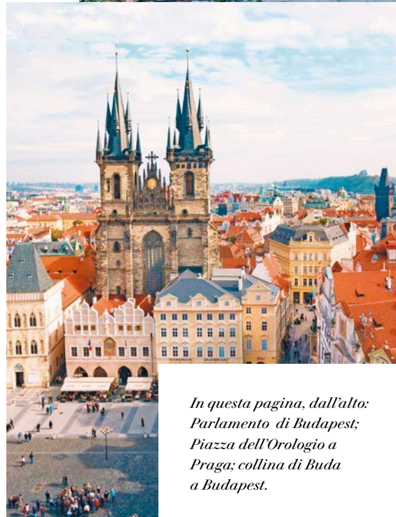
In questa pagina, dall'alto: Parlamento di Budapest; Piazza dell'Orologio a Praga; collina di Buda a Budapest.